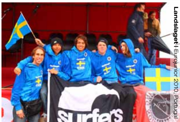
Landslaget | Eurojunior 2010, Portugal