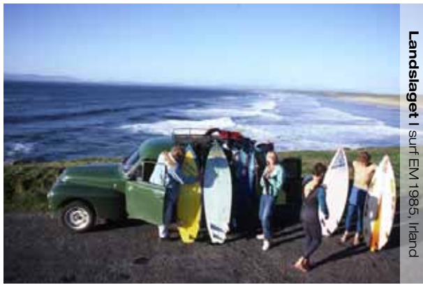
Landslaget | surf EM 1985, Irland