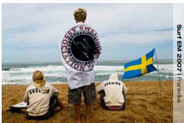
Surf EM 2007 | Frankrike

Swedish Surfing Association grundades för 25 år sedan för att skicka ett lag till EM på Irland. Då var Sverige en blåbärsnation i sammanhanget, representerat av ett gäng entusiaster som kompenserade sin förmåga med sin kärlek till sporten. Idag har Sverige utvecklat en tävlings och landslagstradition som endast de allra största surfnationerna