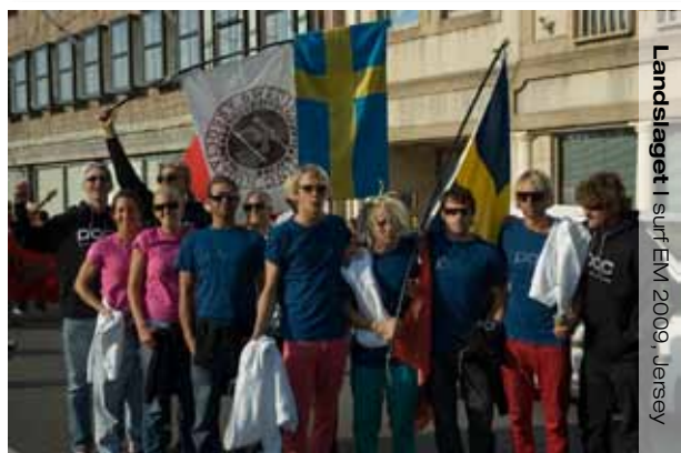
Landslaget | surf EM 2009, Jersey

SSA lägger nu upp planer och målsättningar som sträcker sig över fler verksamhets år. Målet är att successivt utvecklas och bli ännu bättre på det vi redan gör men att kunna expandera verksamheten ännu mer. Svenska Surfförbundet, SSA behöver stöd och hjälp att fortsätta och utveckla sin verksamhet enligt de riktlinjer som dragits upp under desenaste åren.